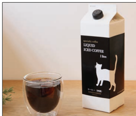
オリジナルコーヒー by KINGLY COFFEE