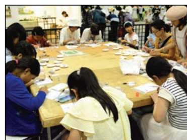
体験教室の様子・2