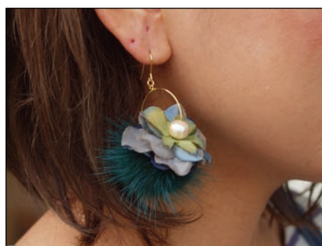
フラワーイヤークセサリー by flare flower