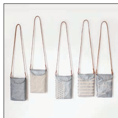
帆布鞆 by SOUPROJECT