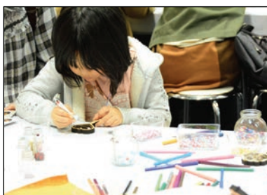
体験教室の様子・1

子供から大人まで、ハンドメイドをしたことがない方でも気軽に参加できる体験教室「マルシェのがっこう」を開催。ものづくり市民が先生となり、アクセサリやフラワーアレンジ、クラフト、伝統工芸まで、 世界にひとつ・自分だけのハンドメイド作品づくり を体験できます。