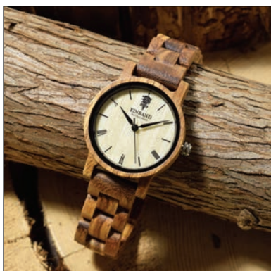
天然木の腕時計 by EINBAND