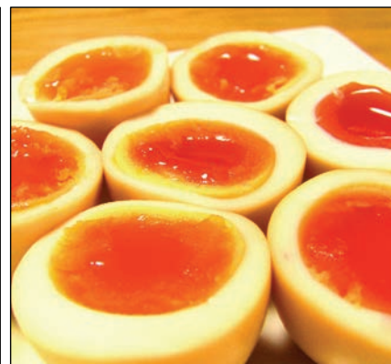
半熟卵のスモーク by 日和佐燻製工房