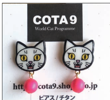
イヤークセサリー by COTA9