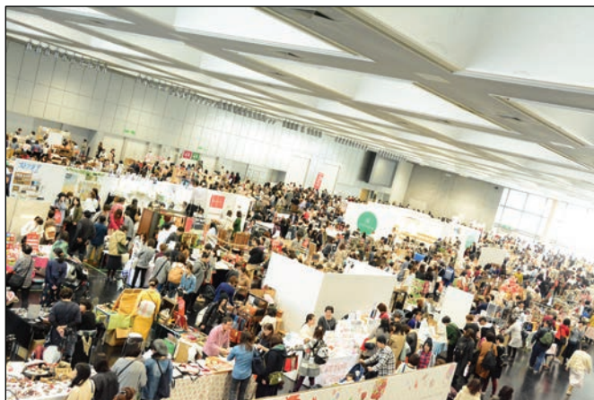
過去開催時の会場の様子▶

京都最大級のハンドメイドイベントとして2017年11月に初開催し今回が2回目となる「京都ハンドメイドマルシェ」。昨年の初開催では6,000人を超える方々が来場しました。会場は、京都最大級のイベント会場「京都市勧業館みやこめッセ」。4,000㎡の会場にハンドメイドの作り手と買い手が集まり、2日間を通じて”ものづくり”を軸とした交流が広がります。