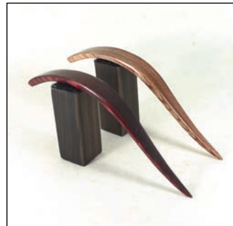
出品例2：木のかんざし