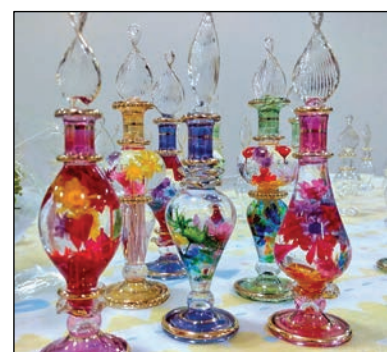
ハーバリウム(植物標本) by 826252