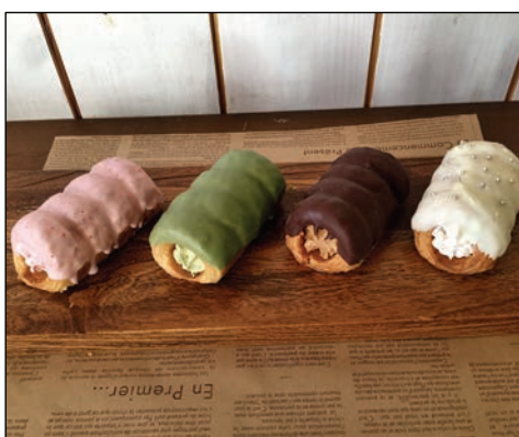
デニッシュ生地のコルネ by ル・クロエ